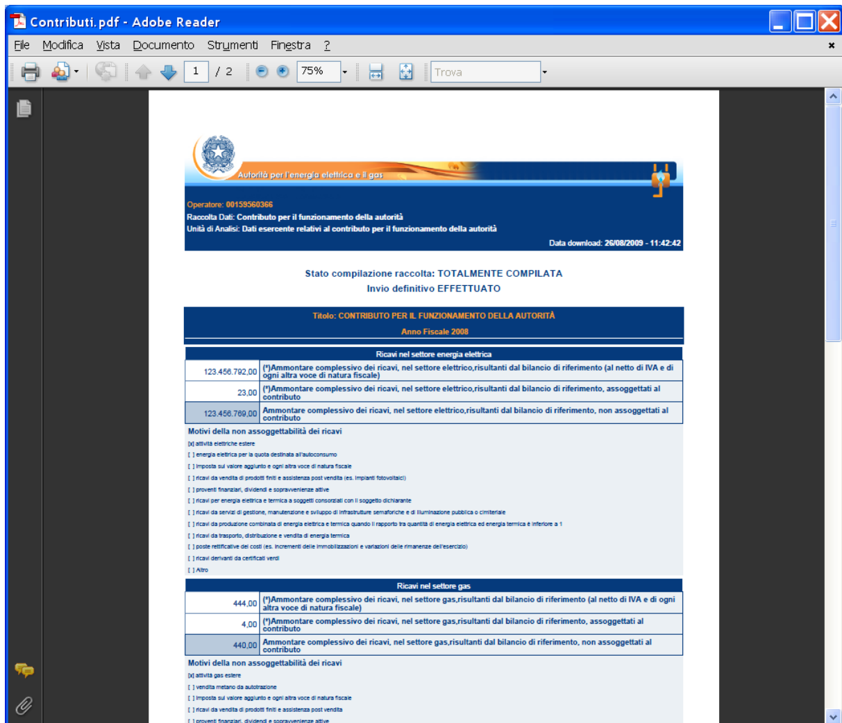
Figura 8 - Modulo pdf precompilato