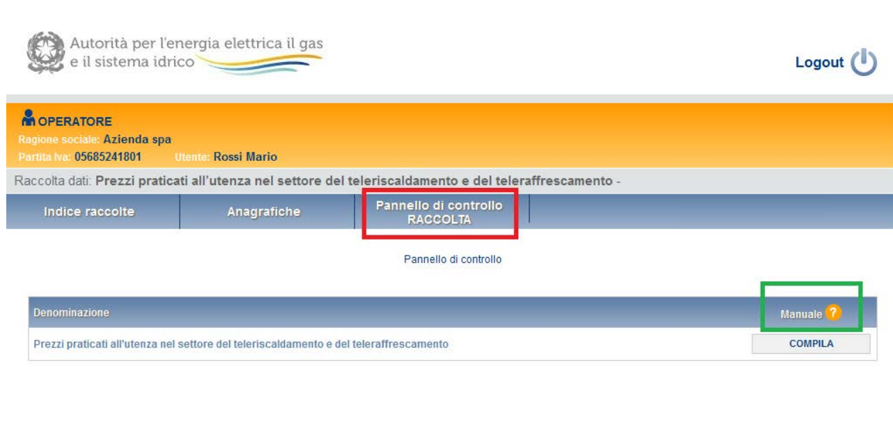
Figura 3.1: pannello di controllo

Accedendo alla raccolta viene visualizzata la pagina “ Pannello di controllo ” dove sono presenti le maschere da compilare per la raccolta (riquadro rosso in figura 3.1): Nel caso in questione è presente una sola maschera, il cui nome coincide con quello della raccolta.