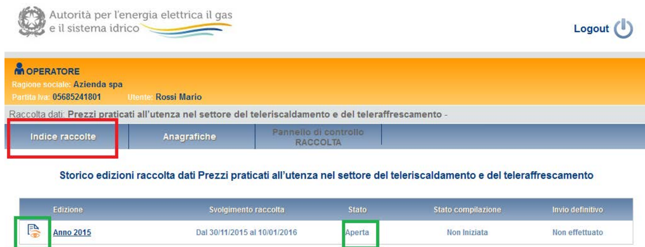
Figura 2.2: storico della raccolta